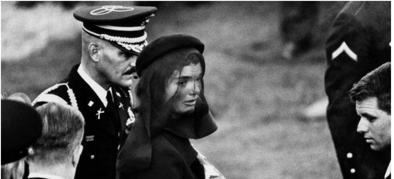
Jacqueline Kennedy en el funeral de JFK.

Además de sostener en el tiempo relaciones con la mafia, “la justificación de Ruby para el homicidio de Oswald es sencillamente es increíble. Dijo que quería resarcir a Dallas del asesinato de JFK y tratar de evitar a Jacqueline Kennedy testificar al lado del asesino de su marido” .