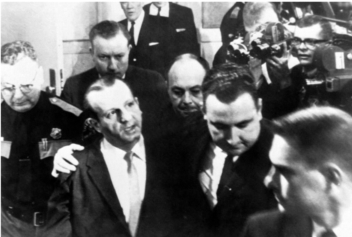
Ruby, después de recibir su veredicto en marzo de 1964.

Según concluyó la Comisión Warren, Ruby se encontraba en el diario, entregando a redacción los anuncios de sus clubes nocturnos, cuando se enteró de lo que había ocurrido. La hora, alrededor de las 12:45, quince minutos después de los disparos. Las oficinas se encontraban a apenas seis manzanas del lugar donde se produjo el atentado. Ruby abandonó la redacción entre media hora y tres cuartos de hora más tarde, y según algunos testigos y las grabaciones de circuito cerrado, fue visto en el cuartel de la policía de Dallas a lo largo de eses día. Allí se hizo pasar por un periodista (había trabajado para el 'Dallas Times Herald'), y escuchó en rueda de prensa afirmar al fiscal Henry Wade que Oswald era un miembro del comité por una Cuba Libre. Error; en realidad se trataba del comité Pro Trato Justo a Cuba, como le hizo notar el propio Ruby.