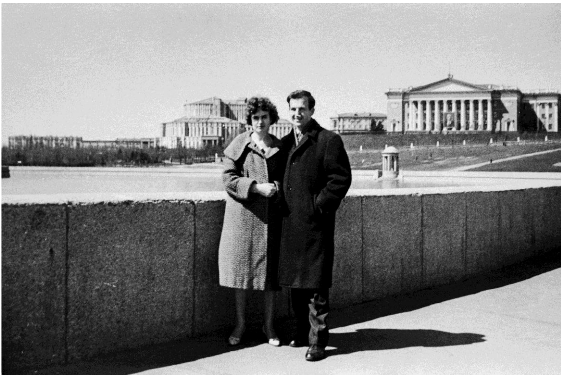
Lee Harvey Oswald con su mujer Marina Prusakova en el parque en Minsk.