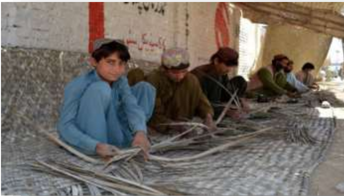
El trabajo infantil en Pakistán ha llegado a ser considerado una verdadera plaga. Estos jóvenes tejedores no podrán tener sueños en una sociedad donde son solo piezas de recambio en el trabajo.

El sector que más utiliza a los niños es la agricultura, principalmente para el consumo doméstico. Las industrias peligrosas como la fabricación de ladrillos también utilizan ampliamente a niños trabajadores para mantener bajos los costos, pero la industria internacional más grande que depende de los niños trabajadores es el tejido de alfombras.