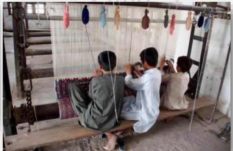
Tejedores infantiles en Pakistán. La industria de alfombras es la más voraz en cuanto al trabajo esclavo infantil.

Esta es la razón por la que la implementación de las leyes sobre trabajo infantil ha sido tan difícil en