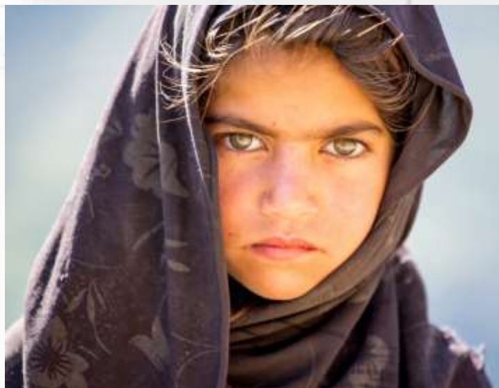
Las redes de la prostitución infantil en Pakistán rompen los sueños de un gran porcentaje de niños, sobre todo en el Punjab, donde la pobreza lleva a las familias a esta situación lamentable.

En la actualidad reciente, se ha determinado que por cada 10 víctimas detectadas en el mundo en 2018, unas cinco eran mujeres adultas y dos eran niñas. Alrededor del 20% de las víctimas de la trata de personas eran hombres adultos y el 15% eran niños.