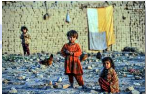
Más de 23 millones de niños pakistaníes, sobre todo en las áreas rurales, están excluidos del sistema educativo.

Pakistán tiene unos 160 millones de habitantes, de los que más de la mitad son menores de 18 años . Se calcula que antes de la crisis económica actual, unos cuarenta millones de personas (la mayoría niños y mujeres), vivían bajo el umbral de pobreza. Más de un tercio de las mujeres no sabe leer o escribir, y sólo seis de cada diez niñas va a la escuela, de las cuales la mayoría no llega a completar el ciclo de la enseñanza primaria .