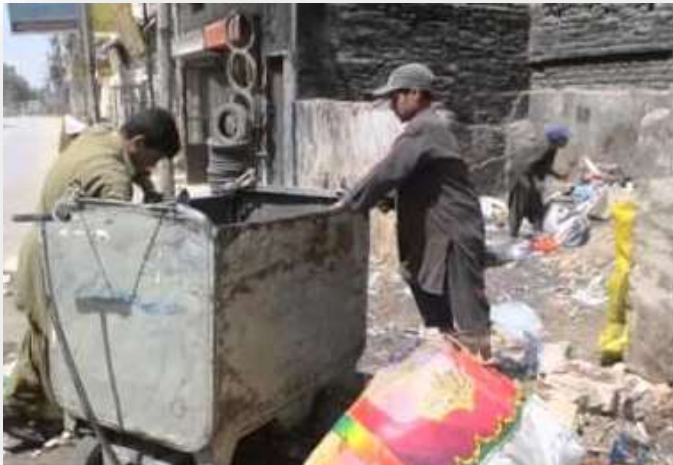
La necesidad de ingresos destruye los sueños de miles de niños pakistaníes.

Cuando una familia se encuentra en una situación de pobreza, tal circunstancia puede llevarlos a tomar medidas desesperadas con respecto a métodos de generar ingresos, al menos 8 millones de niños en Pakistán trabajan y al menos el 65% trabajo tiempo completo ya que son el único sustento económico de su núcleo familiar.