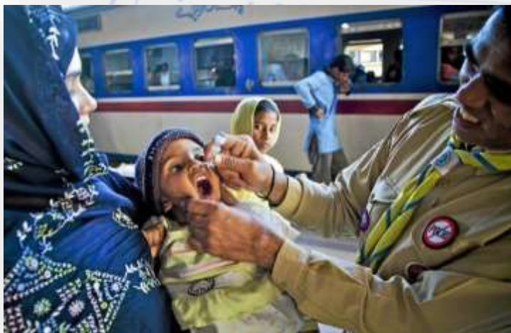
Vacunación contra la poliomielitis en Pakistán.

UNICEF apoya al gobierno a través de su experiencia técnica y trabajo multisectorial en Pakistán , ayuda a las madres, los recién nacidos y niños más desfavorecidos a beneficiarse de intervenciones de salud integradas y la adopción de mejores prácticas/comportamientos de atención médica para ayudar a los niños a sobrevivir y prosperar.