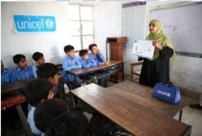
El apoyo de UNICEF se hace presente en escuelas como las del Punjab.

niños sin escolarizar en los niveles de preescolar, primaria y secundaria inferior. El programa educativo se enfoca en la Educación de la Primera Infancia para mejorar la preparación escolar; expansión de vías alternativas de aprendizaje equitativas y de calidad en los niveles de educación básica; y fomentar los vínculos entre la escuela y la comunidad para aumentar la matriculación a tiempo, reducir la deserción y garantizar la finalización y la transición de todos los estudiantes.