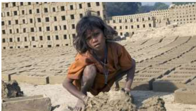
El trabajo infantil en las fábricas pakistaníes de ladrillos es uno de los más espantosos, con jornadas de más diez horas y paga miserable en condiciones totalmente inadecuadas.

barata. Por lo tanto, el trabajo infantil es una parte definida de la sociedad paquistaní, pero si queremos hacer cumplir un derecho global a una infancia saludable, el cambio es necesario. Simplemente no será fácil.