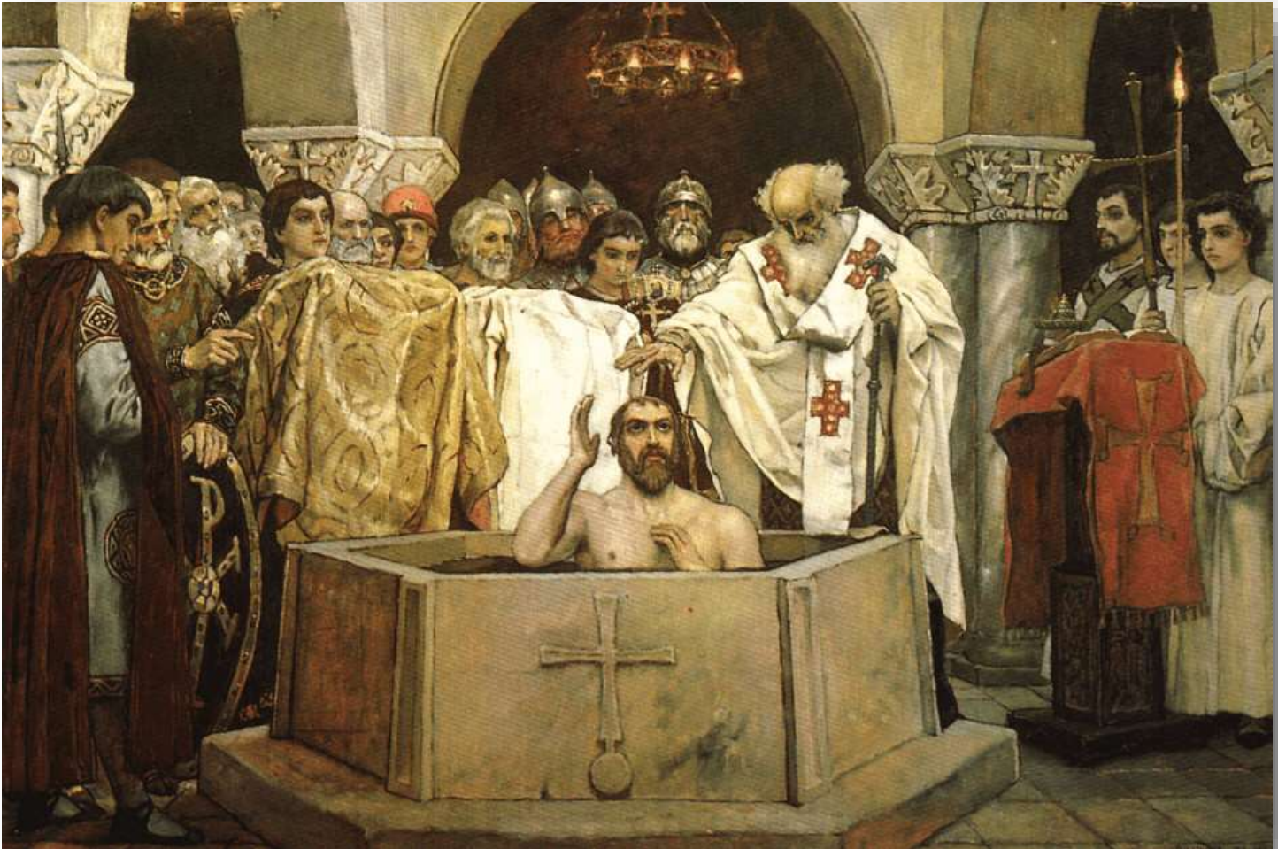
La conversión de Vladimir El Grande al cristianismo ortodoxo y la adopción del eslavo como lengua oficial de la Iglesia Ortodoxa de la Rus de Kiev, la convirtió en el primer estado eslavo de Europa. En la imagen, el momento del bautizo del que es considerado Padre de la Patria en Ucrania y en Rusia.

Rusia se ve como la heredera de la Rus porque el principado de Moscú, del que nacería el Estado ruso, fue el único que sobrevivió a la invasión mongola. La visión más conservadora rusa es que Rusia y Ucrania son lo mismo. Se considera a Vladímir I el padre de la nación rusa. Ucrania también considera a Vladimír I el padre de su nación. Para ellos la Rus fue un Estado ucraniano y Rusia surgió después, al norte y con raíces finesas-