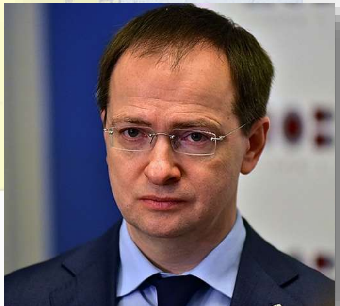
Vladimir Medinsky, el asesor presidencial ruso encargado de negociar con Ucrania.

7 DE MARZO DE 2022: Tiene lugar una tercera ronda de conversaciones entre Rusia y Ucrania, que no cumple las expectativas rusas, según anunció en la televisión estatal Russia 24 el asesor presidencial ruso Vladimir Medinsky, que encabeza la delegación rusa para las conversaciones con Ucrania.