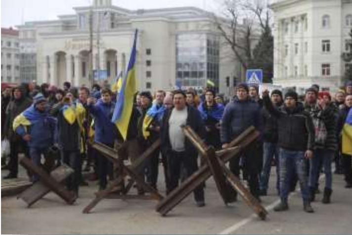
La gente grita a los soldados del ejército ruso durante una manifestación contra la ocupación rusa en la plaza Svobody (Libertad) el lunes 7 de marzo de 2022, en Jersón, Ucrania.

acudieron a la administración de la ciudad", indicando que la localidad ahora está bajo control ruso. Las autoridades de Járkiv dicen que 34 civiles murieron el día pasado durante los ataques rusos.