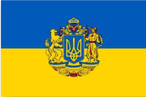
Escudo de Armas de Ucrania.

menospreciados y perseguidos durante muchos años.