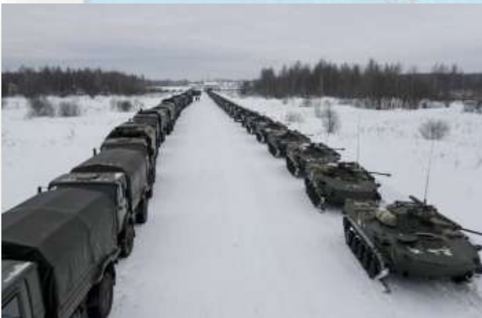
Caravana de vehículos militares rusos. Las maniobras militares en Crimea agregaron más tensión a la situación entre Rusia y Ucrania.

11 Y 12 DE ENERO DE 2022: Una reunión entre Washington y Moscú —el 11 de enero en Ginebra (Suiza)— y otra celebrada al día siguiente entre la OTAN y Rusia concluyen sin avances. Moscú informa del inicio de unas maniobras militares en el sur de Rusia, el Cáucaso y Crimea.