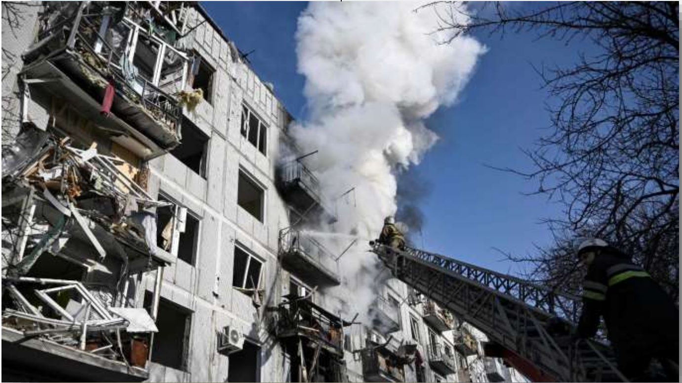
El jueves 24 de febrero de 2022, un edificio fue impactado en la ciudad de Chuguyiv, en el este de Ucrania, mientras las fuerzas rusas atacaban el país.

y el sur. Moscú defiende que es una operación para “desmilitarizar” el país vecino, pero no pretende la ocupación.