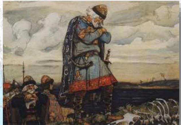
Riúrik, fundador de la dinastía rúrika.

liderada por Subotai , uno de los generales de Gengis Khan , en el siglo XIII . Recibe su nombre de la dinastía rúrika , fundada por el varego Riúrik en 862 . Debido a las incursiones de los jázaros, posteriormente el príncipe Oleg trasladó la capital a Kiev.