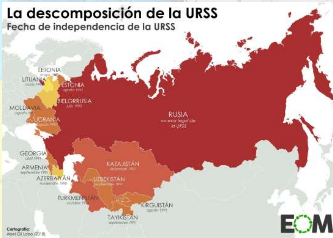
Mapa de la antigua Unión de Repúblicas Socialistas Soviéticas (URSS) con las fechas de separación de sus antiguos miembros.

Repúblicas Socialistas Soviéticas (URSS). Ese estado nació cuando, después de la Revolución de 1917, el Imperio de los zares de Rusia se deshizo y un número importante de países surgieron de sus cenizas: Polonia, Estonia, Letonia o Lituania, pero también otros como Ucrania y Georgia y, por supuesto, la república de Rusia.