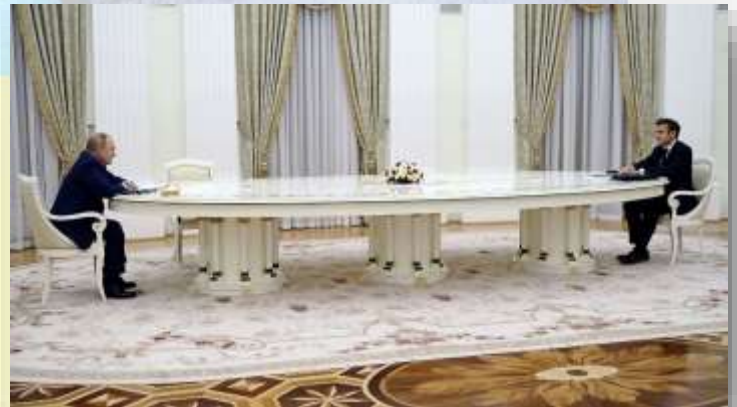
El presidente ruso, Vladimir Putin, y su homólogo francés, Emmanuel Macron, durante la reunión el 7 de febrero en Moscú.

7 DE FEBRERO DE 2022: Emmanuel Macron pide a Putin evitar la guerra: “Los próximos días serán decisivos”. Separados por una enorme mesa —casi tan grande como la distancia que hoy aleja a Moscú de la OTAN—, los presidentes de Rusia y Francia se reunieron en busca de una respuesta al avispero ucranio. Putin ejerció de anfitrión y escuchó el intento del presidente francés de lograr una desescalada que alejara la amenaza de guerra. La visita de Macron a Moscú no logró arrancar ninguna concesión en firme del Kremlin en torno a Ucrania.