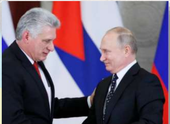
El presidente cubano, Miguel Díaz-Canel, y el ruso, Vladimir Putin, en el Kremlin, en una imagen de 2018. MAXIM SHEMETOV

En una conversación telefónica con el secretario de Estado estadounidense, Wang asegura que “las preocupaciones de seguridad de Rusia deben tenerse en cuenta y recibir una solución” . Por otro lado, por esos días Rusia escenificó un notable acercamiento con Cuba , su antiguo aliado, y lo hace en un ambiente de tensión internacional creciente.