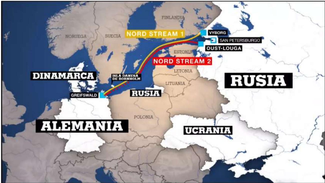
Gasoducto Nord Stream 2

Nord Stream 2, proyecto gasífero que avivó la tensión entre Rusia y Ucrania y pone a prueba la fortaleza de la alianza atlántica.