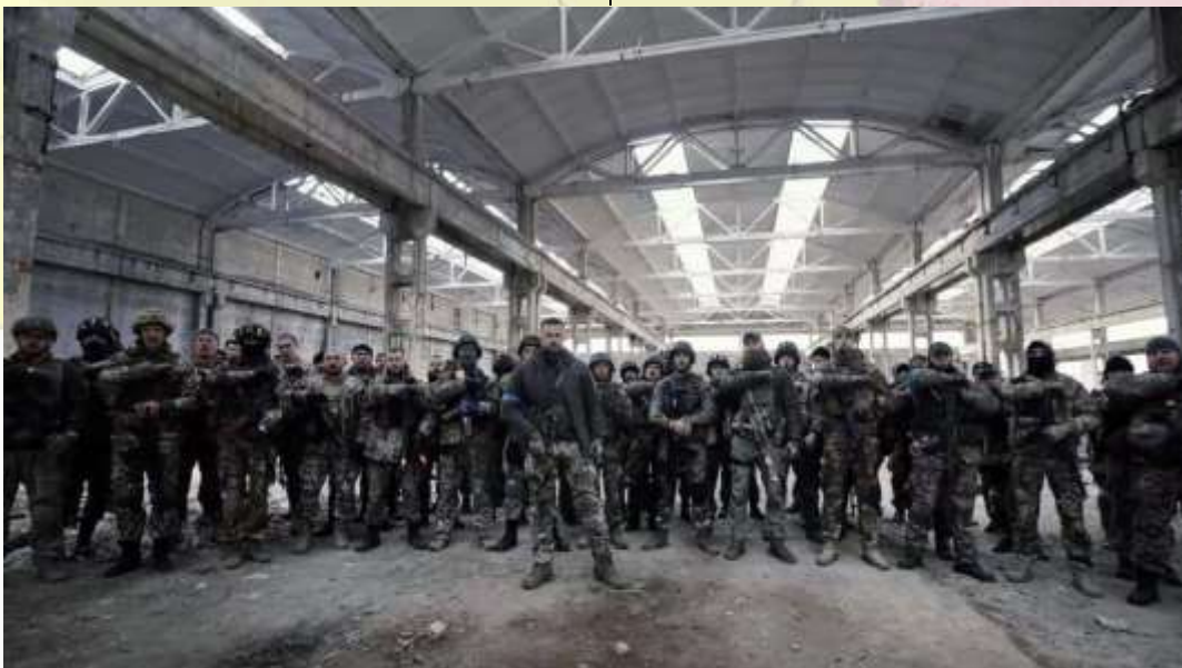
Andriy Biletsky durante un mensaje por redes sociales con el Batallón Azon desde Mariupol.

En lo que a la guerra se refiere, nos encontramos en una situación estancada, donde ambos bandos progresan y retroceden en los frentes del conflicto. En Mariupol, las tropas restantes del batallón Azov han sido atrapadas en la planta siderúrgica de Azovstal, junto a otros 200 civiles que poco tienen que ver con el conflicto, en espera que se dé un cambio que les permita evacuar. Mientras que en el frente de Kherson y Járkov vemos cómo el ejército ucraniano va repeliendo las ofensivas del ejército ruso, que centra sus mayores esfuerzos en los mismos.