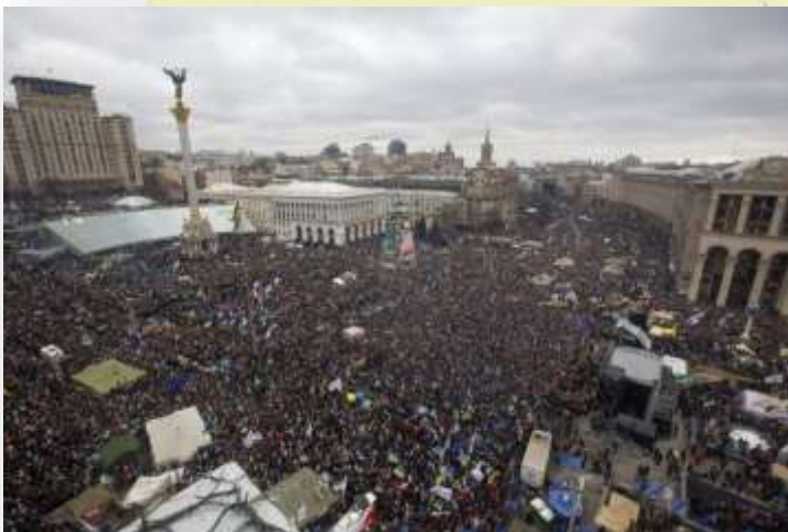
El Euromaidan en Kiev, las grandes protestas terminarán por hacer caer al gobierno del prorruso Viktor Yanúkovich.

NOVIEMBRE DE 2013: El entonces presidente de Ucrania , el prorruso Víctor Yanukóvich , suspende la firma de un acuerdo de asociación con la Unión Europea, prevista el 29 de noviembre, a causa de las presiones de Rusia, que le ofrece además importantes contrapartidas económicas por ello, como la reducción del precio del gas. Este anuncio cataliza el descontento de la población, sobre todo en el oeste del país. El 24 de noviembre, decenas de miles de ucranios se manifiestan contra el Gobierno en la plaza de la Independencia (Maidán) de Kiev.