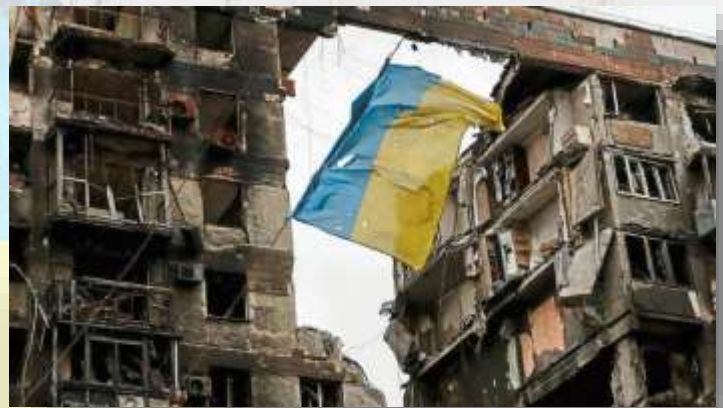
Una vista muestra una bandera rota de Ucrania colgada en un cable frente a un edificio de apartamentos destruido durante el conflicto entre Ucrania y Rusia en la ciudad portuaria del sur de Mariupol, Ucrania. (imagen del 14 de abril de 2022).

1 DE MARZO DE 2022: El presidente ruso, Vladímir Putin, intensifica su ofensiva contra Ucrania. A medida que las tropas de