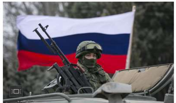
Un uniformado a bordo de un blindado ruso en Baladava (Crimea).

Aprovechando una crisis política en Ucrania en 2014 , con manifestaciones y violencia callejera, Vladimir Putin ordenó a sus tropas invadir de forma anónima (sin uniforme) la península de Crimea, que formaba parte de Ucrania. También impulsó levantamientos en dos provincias fronterizas con Rusia (Donetsk y Lugansk) , que convirtieron esa parte del país en una zona de guerra durante muchos años. Los intentos de acuerdo en la ciudad bielorrusa de Minsk no sirvieron de mucho.