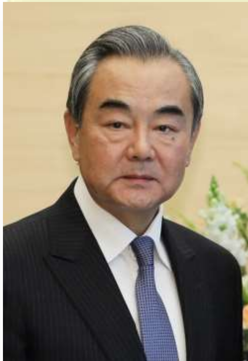
El ministro de Asuntos Exteriores de China, Wang Yi, dejó claro que China apoya las reivindicaciones de seguridad de Rusia.

27 DE ENERO DE 2022 : China se alinea con Rusia sobre Ucrania. El ministro de Asuntos Exteriores de China, Wang Yi, rompe el silencio administrativo —ese de “quien calla, otorga”— de su país en torno a la amenaza de Rusia sobre Ucrania. Y lo hace para dejar claro que las simpatías de Pekín están con Moscú.