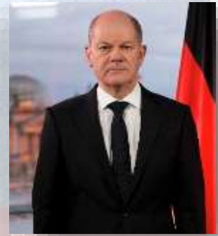
Joseph “Joe” Biden, presidente de Estados Unidos (izq.) y Olaf Scholz, Canciller de Alemania (der.).

Alemania, que está del lado de Ucrania, es el que menos alza la voz sobre Nord Stream 2 entre sus pares, pues su seguridad energética podría verse comprometida si el megaproyecto no llega a ver la luz. El canciller Scholz no confirmó explícitamente que la puesta en marcha del tubo se vaya a frenar si Rusia invade a su vecino.