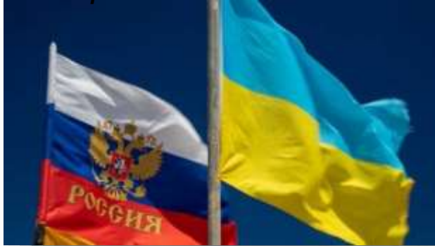
“Un solo pueblo”, así define Vladimir Putin la histórica relación entre Rusia y Ucrania. En la imagen, las banderas rusa y ucraniana.

Europea a la antigua república soviética, a la que Moscú considera parte de su identidad y de su espacio de influencia, y cuyo control juzga vital para su seguridad. Putin cree que ambos países conforman “un solo pueblo”.