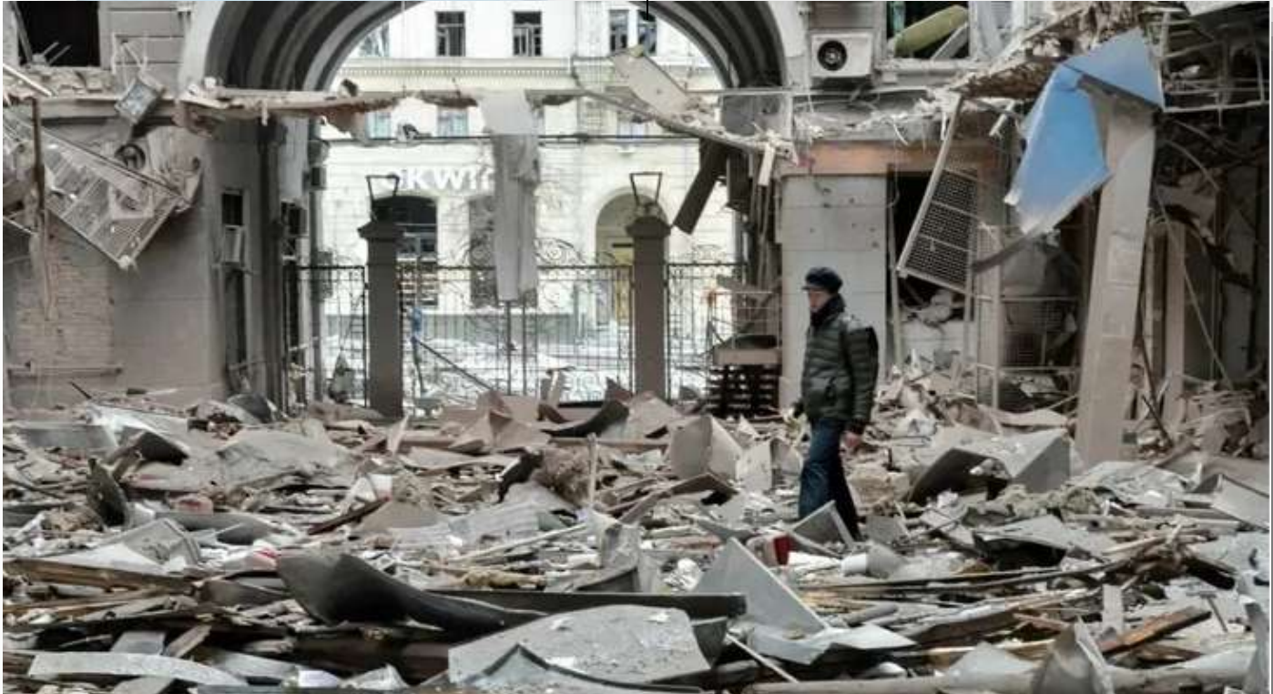
Los ataques de Rusia sorprendieron a la población civil de Sumy durante la madrugada.

ataques aéreos en los últimos días. En tanto, Biden anuncia la decisión de Estados Unidos de prohibir las importaciones de petróleo, gas natural y carbón de Rusia como respuesta a la invasión de Ucrania.