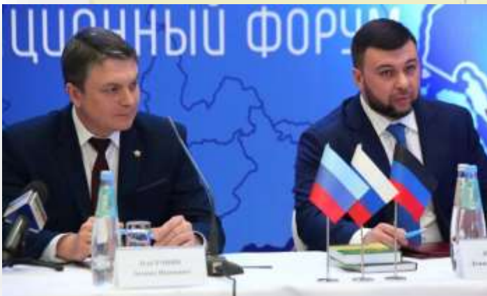
Los líderes separatistas de las autoproclamadas repúblicas de Lugansk y Donetsk, Leonid Pasechnik (izq.) y Denis Pushilin (der.), respectivamente.

Los líderes separatistas de Donetsk, Denis Pushilin, y de Lugansk, Leonid Pasechnik, aseguraron que los territorios han sufrido varios ataques y anunciaron el inicio de una “evacuación masiva de civiles” a la vecina región rusa de Rostov. Además, informaron de la explosión de un coche bomba en las inmediaciones del edificio del Gobierno de Donetsk, recogida por la agencia estatal rusa Tass, que no causó víctimas. Los medios estatales rusos mostraron imágenes de colas en cajeros automáticos, gasolineras y también de grupos de niños haciendo fila para la evacuación.