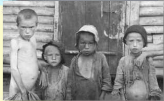
Aunque algunos propagandistas han intentado negarlo o desvirtuarlo, el Holodomor fue un acto criminal que llevó a la muerte a millones de ucranianos.

Con el tiempo, Ucrania dentro de la URSS se recuperó y llegó a ser uno de los territorios más importantes de la Unión Soviética. Tenía una gran industria y era considerada como el granero del país: producía una gran cantidad de trigo y pan.