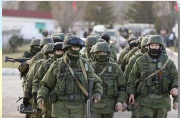
Tropas rusas en Crimea. 2014.

FEBRERO DE 2014: Las fuerzas de seguridad ucranias matan a al menos 100 personas en las protestas. La indignación popular y la brutal represión fuerzan la huida de Yanukóvich . Mientras, en Simferópol , la capital de la península ucrania de Crimea, militantes prorrusos se enfrentan a partidarios de la unidad de Ucrania. Al mismo tiempo, militares rusos camuflados y agentes del espionaje del Kremlin penetran en Crimea para forzar su anexión a Rusia.