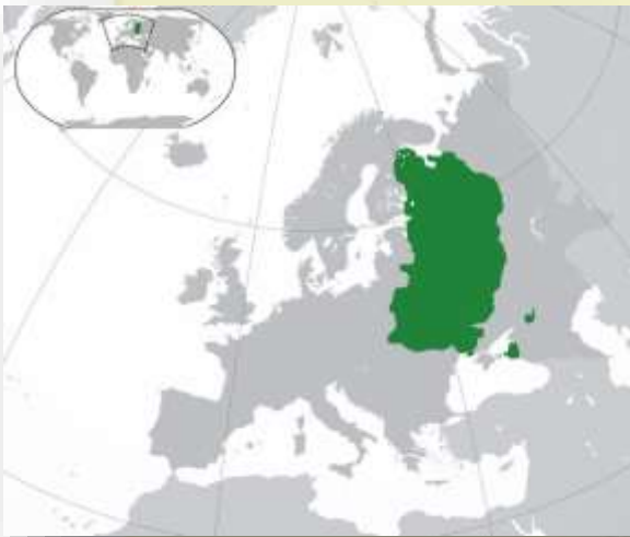
Territorios de la Rus de Kiev.

En la Edad Media había existido un primer estado ucraniano, la Rus de Kiev, que también se considera el inicio de Rusia.