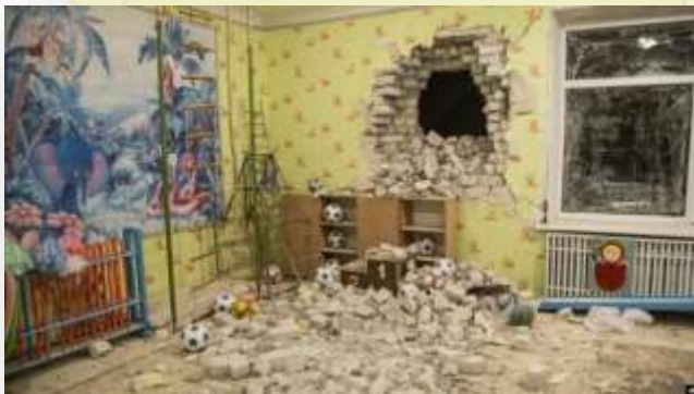
Ladrillos y escombros se mezclan con juguetes debajo de una pared dañada después del bombardeo reportado en un jardín de infantes en el asentamiento de Stanytsia Luhanska, Ucrania, el jueves 17 de febrero de 2022 a última hora.

17 DE FEBRERO DE 2022: El Gobierno ucranio y los separatistas prorrusos respaldados por Moscú intercambian acusaciones de ataques a lo largo de la línea del frente en la región de Donbás. Así, proyectiles de artillería alcanzaron una guardería en la ciudad de Stanytsia Luganska .