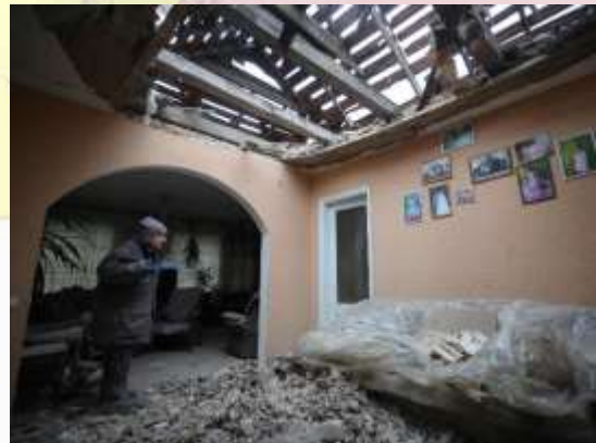
Una residente de Stanytsia Luganska, en la zona del este controlada por Kiev, observa este viernes los destrozos en su casa por un bombardeo.

18 DE FEBRERO DE 2022: Los servicios de inteligencia de Estados Unidos informaron que el Kremlin ya había ordenado proceder a la invasión de Ucrania, según fuentes de la Administración de Joe Biden citadas por The New York Times y The Washington Post. Este dato es lo que llevó al presidente a señalar, por primera vez, que consideraba que Vladimir Putin ya había “tomado la decisión” de atacar la antigua república soviética. Ese mismo día, los separatistas prorrusos dieron la orden de evacuar a civiles en Donbás.