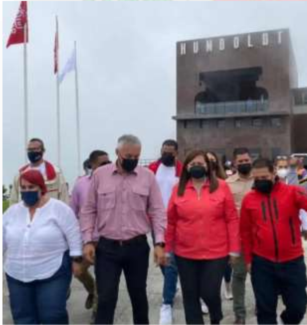
La alcaldesa de Caracas junto al ministro de Turismo Alí Padrón en un recorrido por el Hotel Humboldt, convertido en centro turístico continental.

posteriormente trabajaron en las calles dañadas, plazas y lugares públicos destruidos y abandonados, convirtiendo así a La Candelaria, en menos de nueve meses, en un paseo turístico altamente visitado como en los años 80.