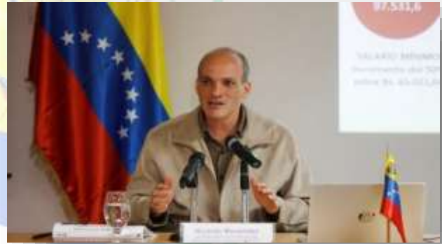
Ricardo José Menéndez Prieto, Vicepresidente del Consejo de Ministros de Planificación y Ministro del Poder Popular de Planificación del gobierno venezolano.

Internacional (FMI) en 10.000.000 % para el 2019 , convirtiéndola así en una de las peores de América Latina. Para marzo de 2020 se hizo evidente la escasez de transporte pesado por la falta de combustible Diésel. "Venezuela lleva 7 años de Recesión económica" declaró el Ministro de planificación Ricardo Menéndez.