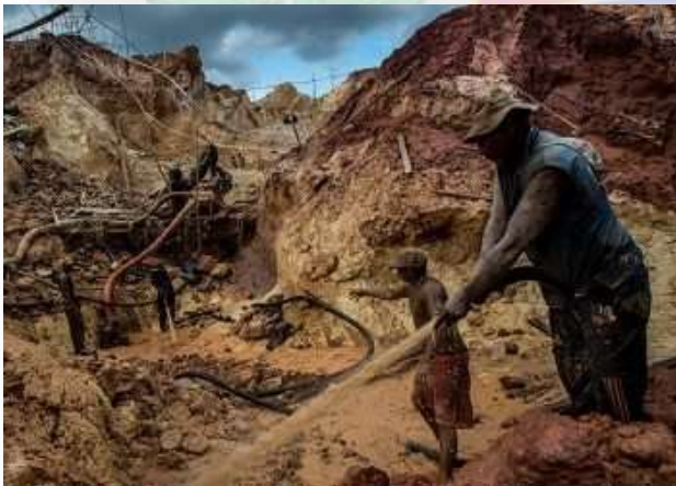
Mineros ilegales en el estado Bolívar, Venezuela.

Pero antes de todo ello, deciden aumentar la seguridad y multas para los trabajadores ilegales en esta área. Los mineros sin licencia no hacen más que saquear los terrenos, además de no realizar los procedimientos adecuados para así obtener todos éstos recursos de manera eficiente, dejando el terreno pobremente explotado, añadiendo más riesgos y complicaciones a nuestros trabajadores.