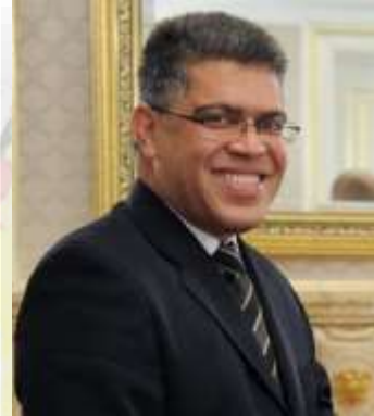
Elías José Jaua Milano, Canciller de la República Bolivariana de Venezuela al momento de fallecer el presidente Hugo Chávez

absoluta del presidente Hugo Chávez , asumió la presidencia de manera interina.