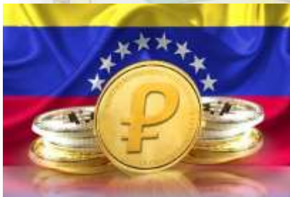
El Petro, la nueva moneda de curso legal en Venezuela a partir de 2021.

Actualmente 1 Petro está estimado en 120,04 Bs. y 60,02 USD americanos.