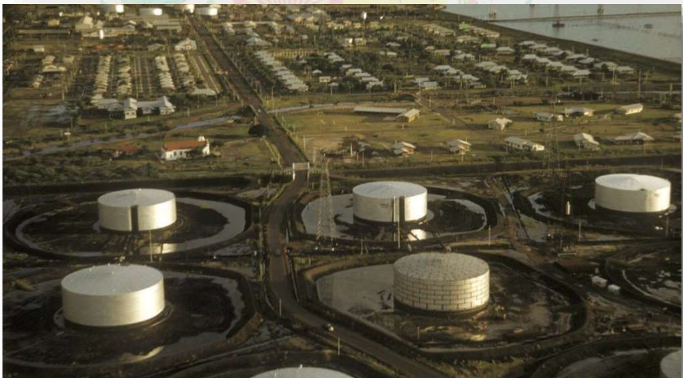
Campos petroleros en Lagunillas, estado Zulia.

presencia del Estado se ha hecho cada vez más débil en el interior del país y su ausencia es particularmente visible en Zulia, el estado más poblado de Venezuela. Su capital, Maracaibo, alguna vez fue el enclave petrolero de Venezuela.