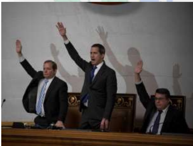
Juramentación de la Junta Directiva de la Asamblea Nacional 2019-2020, al centro Juan Gerardo Guaidó Márquez, nuevo presidente del Parlamento.

Desde el 5 de enero de 2019 , Juan Gerardo Guaidó Márquez fue designado como Presidente de la Asamblea Nacional , siendo la persona más joven en ocupar dicho cargo. El 11 de enero de 2019 , Guaidó anunció que asumiría las responsabilidades del artículo 233 de la Constitución para convocar a nuevas elecciones nacionales . Después de esto, existió la controversia sobre si Guaidó había asumido o no la presidencia interina de Venezuela .