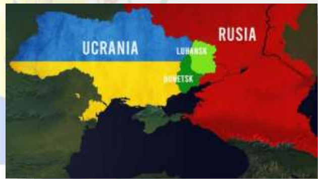
La pugna entre Rusia y Ucrania, que derivaría en una guerra abierta en 2022, causó una grave desestabilización del mercado petrolero mundial.

El 15 de Agosto de 2021 , en vista del bloqueo petrolero por parte de Rusia por sus acciones contra Ucrania , La Organización de los Países Exportadores de Petróleo (OPEP) observando la alta demanda de barriles implementa el nuevo precio para la venta de petróleo aumentando un 90% estimado en U.S. $ 150,00.