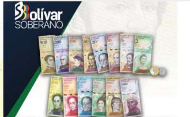
Como Monetario del Bolívar Soberano.

Soberano. De esta manera, se eliminaron cinco ceros a la antigua moneda.