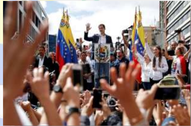
Juramentación de Juan Guaidó como presidente encargado el 23 de enero de 2019.

Posteriormente fue reconocido por el secretario general de la Organización de los Estados Americanos (OEA), el Parlamento Europeo y los gobiernos de países como: Bolivia, Brasil, Canadá, Chile, Colombia, Costa Rica, Ecuador, España, Estados Unidos, Francia, Guatemala, Perú, Paraguay y Reino Unido .