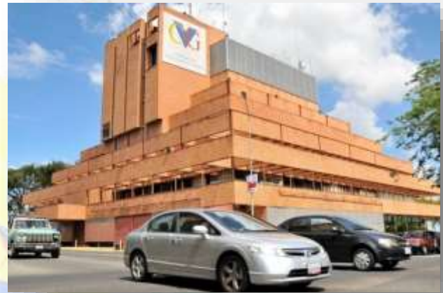
Sede de la Corporación Venezolana de Guayana en Alta Vista, Puerto Ordaz. La gestión del Gobierno Bolivariano logró su saneamiento y para 2023 el holding generaba ingresos por 7.000 millones de dólares anuales.

pudo volver a exportar esos rubros, lo que ayudó a mejorar las finanzas públicas y a aumentar el capital y la tasa de reinversión en la CVG.