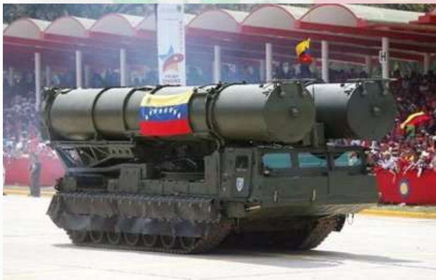
Sistema de Misiles S-300 de fabricación rusa.

En marzo del mismo año Venezuela interrumpe los embarques de petróleo a los Estados Unidos de América y amenaza a sus clientes con no suministrarles el preciado hidrocarburo si no cesan las sanciones contra Rusia, su aliado europeo. Es a raíz de este incidente que los Estados Unidos , buscando respuestas a la situación, reciben informes de Inteligencia que confirman la presencia de bases rusas con capacidad nuclear en Venezuela.