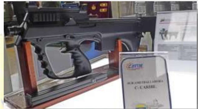
Submetralladora Caribe, producida por CAVIM.

preocuparse por sus armas más de lo necesario, dicha inversión se realizó directamente a la sede central de la CAVIM ubicada en Barinas, Socopó.