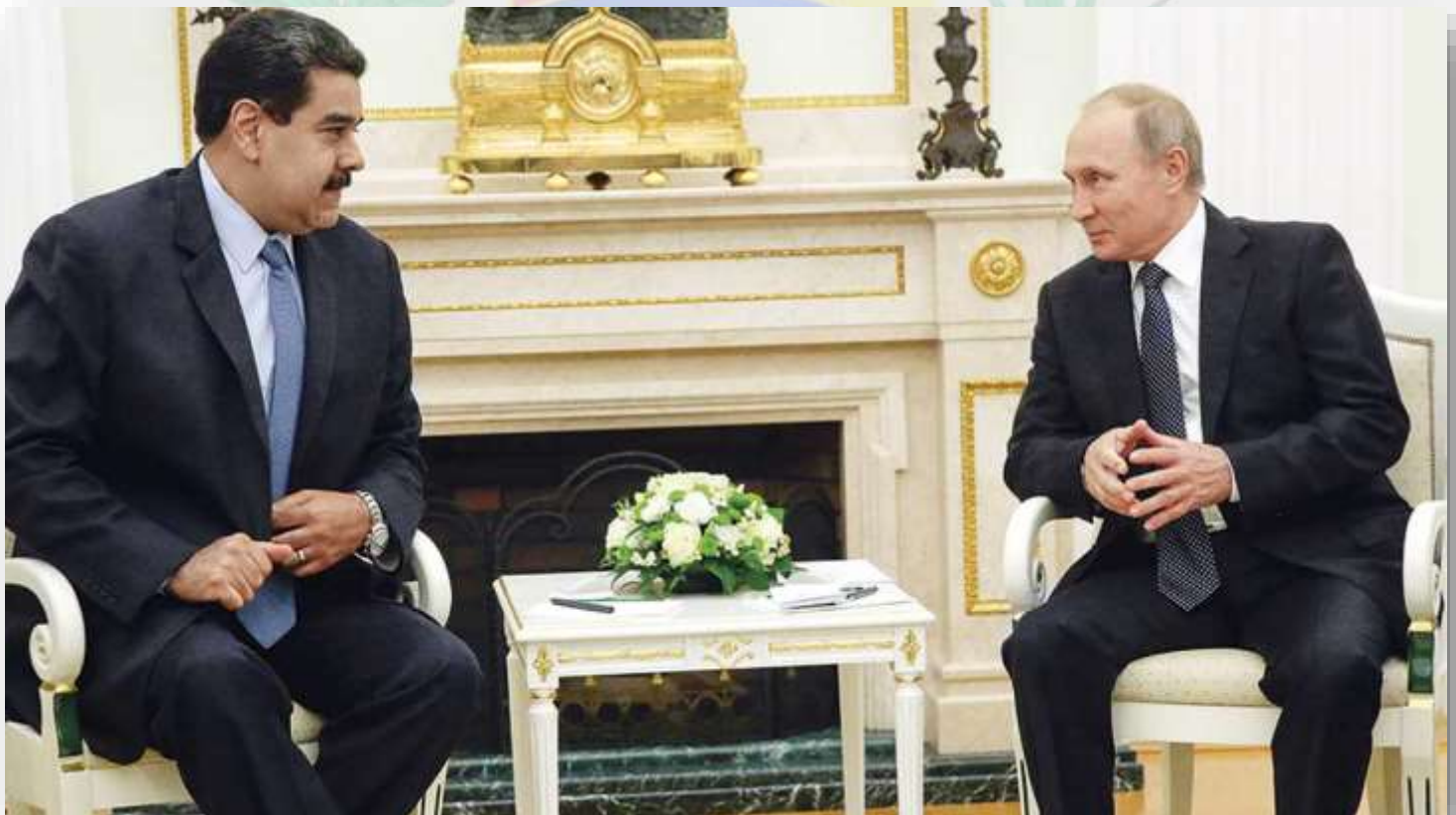
El presidente de la República Bolivariana de Venezuela, Nicolás Alejandro Maduro Moros, junto a su homólogo de la Federación Rusa, Vladimir Putin, durante años, Rusia y Venezuela han estrechado su amistad, pese a la incomodidad de los Estados Unidos.

desarrollado alrededor del mundo en los últimos tiempos, en los cuales Venezuela ha parecido estar involucrada en diferentes asuntos, apoyando a Rusia en la Guerra contra Ucrania y confrontando a la poderosa nación del Norte a pesar de la flexibilización de las sanciones. Muchos recursos venezolanos han servido para aliviar las sanciones que pesan sobre Rusia por su guerra contra Ucrania.