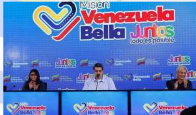
El presidente de la República Bolivariana de Venezuela, Nicolás Alejandro Maduro Moros, junto a la Vicepresidenta Delcy Eloína Rodríguez Gómez, explicando los detalles de la Misión “Venezuela Bella”.

En el mes de marzo de 2022 se inician las reconstrucciones de calles dañadas, electricidad y demás por una orden emitida del presidente hacia los Gobernadores de los 23 estados del país, con el fin de embellecerlos, en el marco de la Misión “Venezuela Bella” .