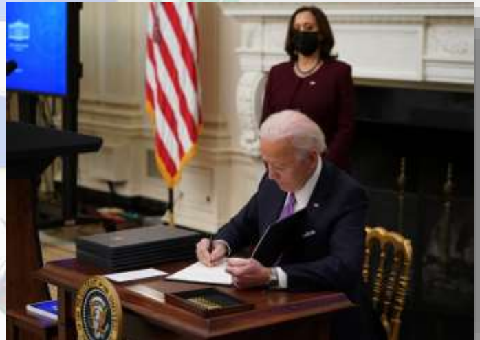
Joseph “Joe” Biden firma la Orden Ejecutiva que oficializa el estado de guerra entre Estados Unidos y Venezuela.

Finalmente, el 24 de junio de 2023 , el actual presidente de los Estados Unidos de América, Joseph “Joe” Biden , “por el bien del país”, refrenda oficialmente la Declaración de Guerra aprobada por el Congreso a la República Bolivariana de Venezuela, a través de una Orden Ejecutiva firmada en la Casa Blanca y difundida a través de un Comunicado Oficial para todas las agencias de noticias del mundo.