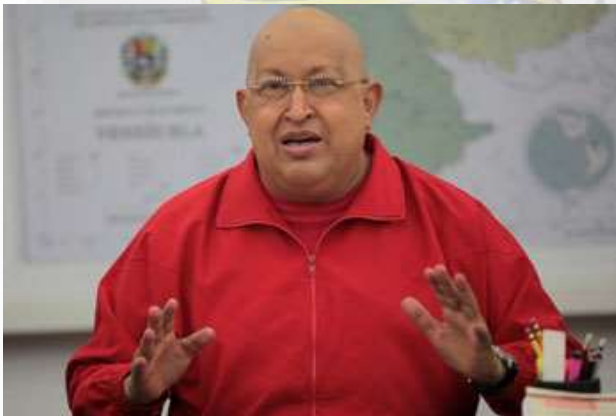
Hugo Rafael Chávez Frías durante su enfermedad.

El fallecimiento del presidente de Venezuela, Hugo Rafael Chávez Frías , tuvo lugar a las 16:25 hora local (20:55 UTC) del martes 5 de marzo de 2013 , en el Hospital Militar Dr. Carlos Arvelo de la ciudad de Caracas , sitio en el cual se encontraba recibiendo tratamiento médico para poder aliviar una infección respiratoria contraída durante la última intervención quirúrgica que se le practicó para combatir un cáncer que lo aquejaba, tras estar casi tres meses internado en el Centro de Investigaciones Médico Quirúrgicas (CIMEQ) de La Habana (Cuba) .