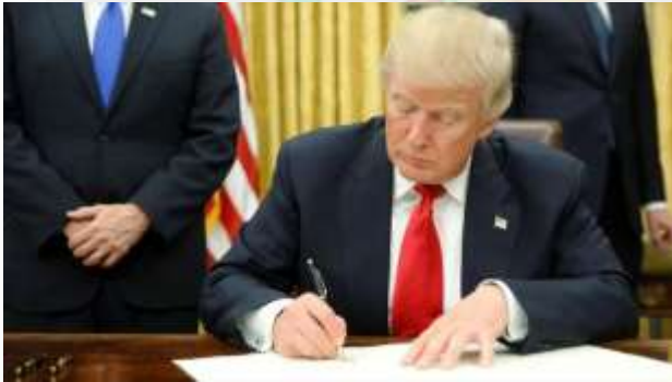
Donald Trump, 45º Presidente de Estados Unidos, firma una Orden Ejecutiva con severas sanciones económicas contra Venezuela.

Venezuela y de la petrolera estatal PDVSA , también impiden la negociación de ciertos bonos que estén en manos del sector público venezolano, así como el pago de dividendos al gobierno de Venezuela.