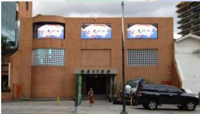
Fachada de uno de los casinos inaugurados en Las Mercedes en 2021.

Los casinos fueron un éxito, personas de poder, clases altas, incluso clase media asistían a los lugares para colocar las mejores de sus apuestas para llevarse una gran fortuna y además de tener la mejor noche de entretenimiento. Sucesivas encuestas y sondeos de opinión demostraban que la ciudadanía consideraba positivamente este gran proyecto.