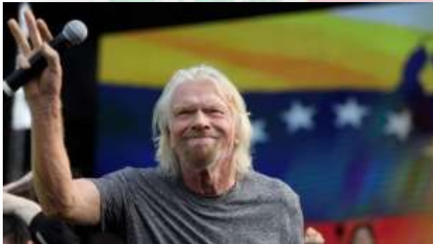
Richard Branson, el multimillonario estadounidense propietario de Virgin Records y organizador del Venezuela Live Aid.

ayudar: niños que pasan hambre todos los días, ancianos que se encuentran en riesgo de muerte debido a la falta de medicamentos, padres y madres a los que no les alcanza el salario para proveer a sus familias, jóvenes que son perseguidos injustamente y a la población en general que merece una vida en paz. En una declaración de Virgin, Branson criticó al "régimen" de Maduro por rechazar la ayuda humanitaria.