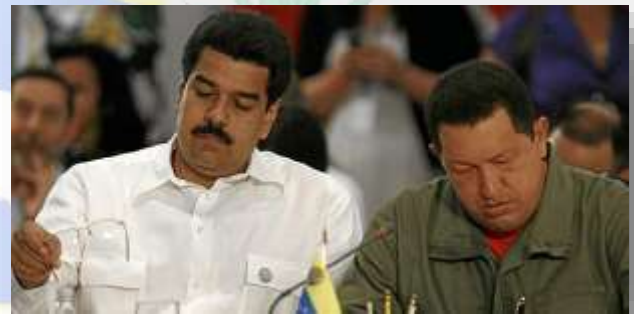
Nicolás Alejandro Maduro Moros junto a Hugo Rafael Chávez Frías, siendo Canciller.

Al día siguiente de su fallecimiento, los restos mortales de Chávez fueron trasladados a la sede de la Universidad Militar Bolivariana de Venezuela (UMBV) , donde se instaló inmediatamente en la capilla ardiente. En tanto, el funeral de Estado se programó para el viernes 8 de marzo del mismo año, día en que Nicolás Maduro Moros asumió el cargo de Presidente formalmente.