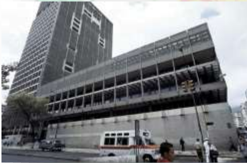
Sede del Banco Central de Venezuela en Carmelitas, Caracas.

El proyecto se pone en marcha en marzo de ese año, con el Banco Central de Venezuela autorizando y anunciando al país la nueva moneda oficial y legal, el Petro, bajo la resolución N° 46-78-33. Este cambio drástico hace que la economía se estabilice un poco y los comercios pequeños empiezan a prosperar.