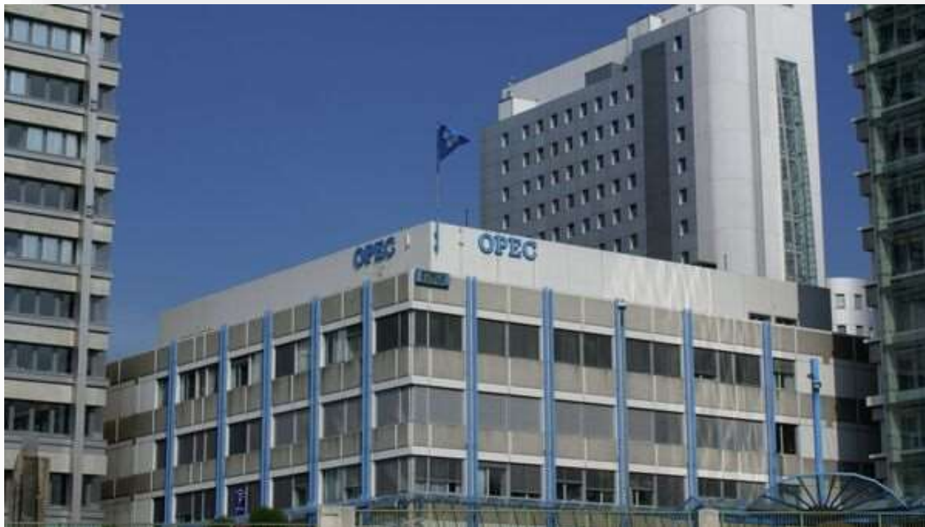
Sede de la Organización de Países Exportadores de Petróleo (OPEP) en Viena, Austria.

Con estas acciones Venezuela financió la reactivación total de las refinerías del Centro de Refinación Paraguaná (CRP) , conformado por las Refinerías Amuay y Cardón , en la península de Paraguaná del estado Falcón y Bajo Grande, en el estado Zulia; la Refinería El Palito , en el estado Carabobo; y el Complejo de Refinación Oriente con el fin de aumentar la producción de barriles diarios, lo que hizo la venta por parte de Venezuela creciera.