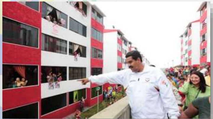
El presidente de la República Bolivariana de Venezuela, Nicolás Alejandro Maduro Moros junto a la Primera Combatiente, Cilia Flores de Maduro, en la inauguración de un Complejo Residencial de la Gran Misión Vivienda Venezuela. Esta Misión, bandera del Comandante Eterno Hugo Chávez, ha recibido un enorme impulso durante la gestión del presidente Maduro.

Misión Vivienda Venezuela, con una arquitectura en su totalidad minimalista, destinados a personas de escasos recursos a las que se les asignaban las viviendas luego de un estudio socioeconómico, para ser canceladas con facilidades de pago y cuotas mensuales y anuales que permitieran recuperar la inversión realizada.