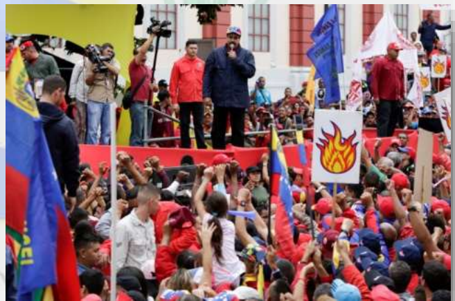
El presidente Maduro Moros dando un discurso a sus seguidores frente al Palacio de Miraflores, sede del Gobierno Bolivariano.

"Tenemos una batalla cruenta contra las sanciones internacionales que le han hecho perder a Venezuela al menos 20.000 millones de dólares en 2018" , aseguró Maduro en un discurso entonces, en el cual también comentó: "Nos persiguen las cuentas bancarias, las compras en el mundo de cualquier producto, es más que un bloqueo, es una persecución" .