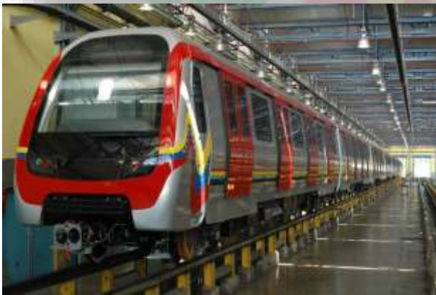
Imágenes de las actividades de mantenimiento, rehabilitación y remodelación en el Metro de Caracas, en el marco del Plan "Futuro País".

por la estación Las Adjuntas remodelando cada estación de la línea hasta finalizar en la estación Zona Rental . Para finalizar con esta parte del proyecto, se lleva a cabo la remodelación de la Línea 3 , iniciando por la estación La Rinconada , remodelando todas las estaciones de la línea y finiquitando con la estación Ciudad Universitaria .