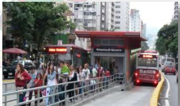
El Sistema BusCaracas, su remodelación fue clave en la mejoría del transporte capitalino.

BusCaracas , con el cambio de las unidades viejas por unidades nuevas, mientras que a las unidades más recientes con algún inconveniente mecánico, se le prestaría el servicio necesario para reactivarlas y dejarlas 100% operativas. Aparte, se decide realizar la creación de nuevas sedes ubicadas en Caracas, La Guaira y Guatire , para próximamente expandirse por el resto del país. Las sedes anteriores a las actuales tendrían reacondicionamientos con el fin de que el servicio sea 100% seguro y profesional, invirtiéndose una cantidad de U.S. $ 12.500.000. Los usuarios tendrían una tarjeta única para usar en el Sistema Subterráneo y de Metrobús, cuyo precio de recarga sería de Bs. 10,00 por 20 viajes, mientras que los tickets de viaje único quedaron en Bs. 1,50 y el pasaje del BusCaracas se estableció en Bs. 3,00.