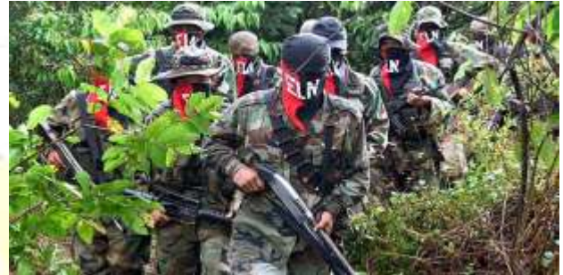
Guerrilla del Ejército de Liberación Nacional. Esta guerrilla junto a las bandas criminales que operaban en el Arco Minero, fue exterminada sin piedad, lo que permitió la recuperación de la actividad minera para el estado venezolano.

del 70% de las guerrillas que tenían invadido el Arco Minero del Orinoco.