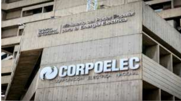
Sede de CORPOELEC en San Bernardino, Caracas.

importante en el Estado Zulia y los estados cercanos.