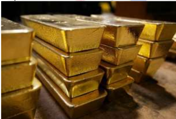
Lingotes de oro venezolano listos para ser exportados (2022).

Para el mes de octubre del año 2020 el Gobierno hace pública una Gaceta Oficial , en la que se menciona que cada persona que ejerza la minería de manera ilegal, tendrá una condena a 15 años de cárcel como mínimo, llegando hasta 30 años como máximo. Seguido a esto, el país decide ayudar a las empresas dedicadas al arco minero durante todo el mes de diciembre de ese año, aportando cuanto necesitaran, con el fin de aumentar la eficiencia en la explotación de estos recursos para exportarlos.