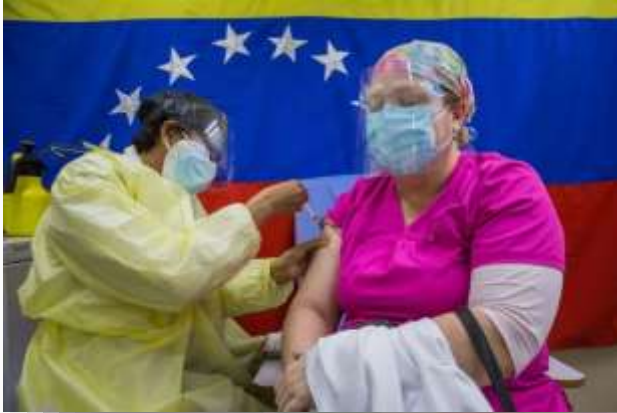
Vacunación contra el COVID-19 en Venezuela.

algunas personas desarrollan casos graves y necesitan atención médica.