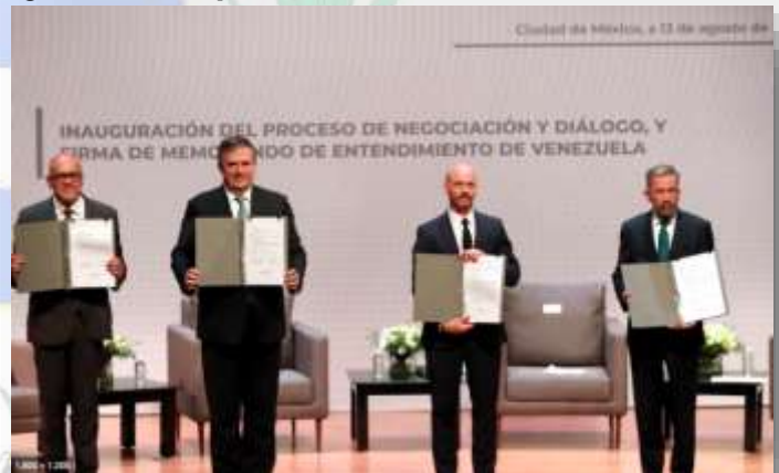
Inicio del Proceso de Negociación y Diálogo entre el Gobierno Bolivariano y la Oposición venezolana en Ciudad de México en 2021.

En el contexto de las negociaciones entre el Gobierno Bolivariano y la oposición , además de la conveniencia política por la situación causada por la guerra abierta entre Rusia y Ucrania, Estados Unidos alivia algunas sanciones económicas a Venezuela a través de un Comunicado Oficial por el Presidente Joseph “Joe” Biden el 19 de Mayo de 2022 , en un gesto destinado a alentar la continuación de las negociaciones entre la oposición respaldada por Washington y el gobierno del presidente Nicolás Maduro .