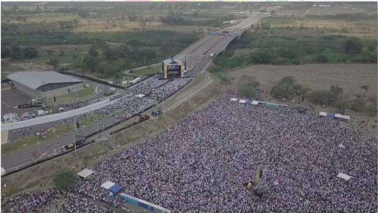
Panorámica del concierto Venezuela Live Aid.

castellano como Música por Venezuela: Ayuda y Libertad , fue un concierto benéfico organizado por Richard Branson y celebrado en el Puente Internacional Tienditas, en Cúcuta (Colombia) , paso fronterizo hacia Venezuela. Tuvo como lema la frase: “Dejen que las estrellas brillen para todos” . Esta iniciativa de gran influencia en el hemisferio, es considerada un hecho histórico.