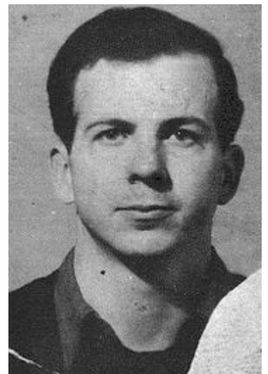
Figura 2 : foto de LHO

Algunos testigos dijeron que el tiro provenía del quinto piso de un gran edificio detrás del coche llamado TSBD. La policía interrogó inmediatamente a los trabajadores del edificio y se dieron cuenta que faltaba uno, sabiendo que fue visto un poco antes: Lee Harvey Oswald (ref. foto de LHO). Otros testigos al ver su foto confirmaron que parecía al hombre vieron. La busca y captura del hombre había empezado.