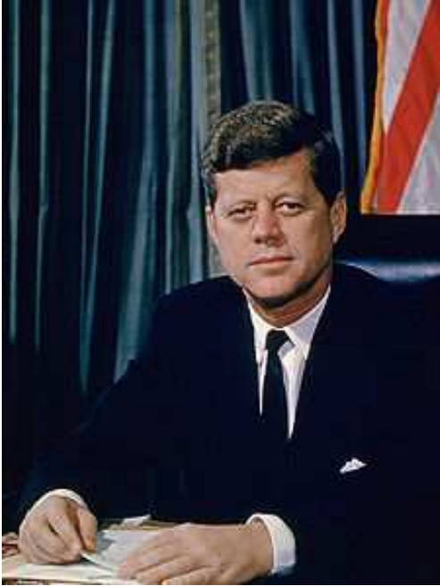
Figura 1 : foto de JFK

John Fitzgerald Kennedy conocido como JFK nació el 29 de mayo de 1917 en Brookline, Massachussets.